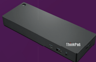
Station d'accueil Thunderbolt™ 4 pour station de travail ThinkPad