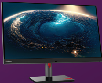
Moniteur ThinkVision P32pz-30