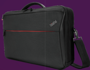
Sacoche compacte à ouverture supérieure ThinkPad Professional 35,56 cm (14")